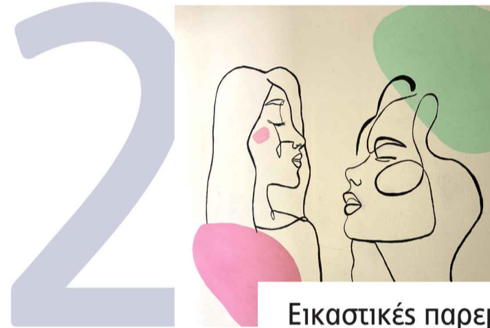
Εικαστικές παρεμβάσεις μέσα στο σχολείο