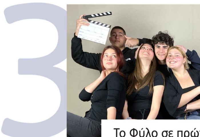
Το Φύλο σε πρώτο πλάνο