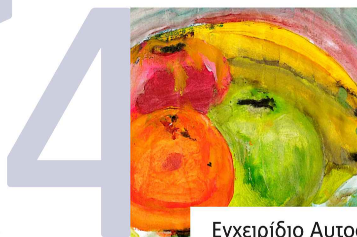
Εγχειρίδιο Αυτοφροντίδας σωστής διατροφής με βάση την εποχικότητα – Φυσικά προϊόντα καλλωπισμού