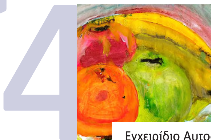
Εγχειρίδιο Αυτοφροντίδας σωστής διατροφής με βάση την εποχικότητα – Φυσικά προϊόντα καλλωπισμού