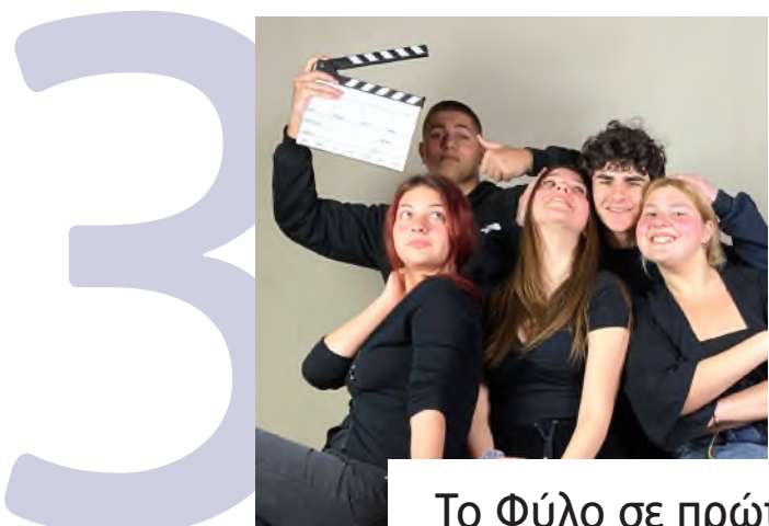
Το Φύλο σε πρώτο πλάνο