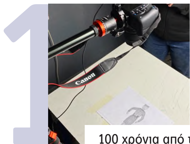
100 χρόνια από τη Μικρασιατική Καταστροφή